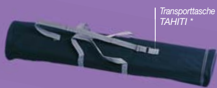
Transporttasche TAHITI *

Effiziente Lösungen für Ihre Ausstellung, POS- (Point of Sales) Animation, Messe, Konferenz, Signage