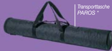
Transporttasche PAROS *

*Alle Displaysysteme incl. einer Transporttasche.