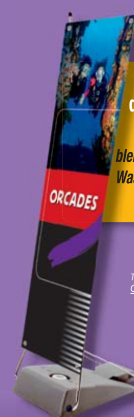
Transporttasche ORCADES *